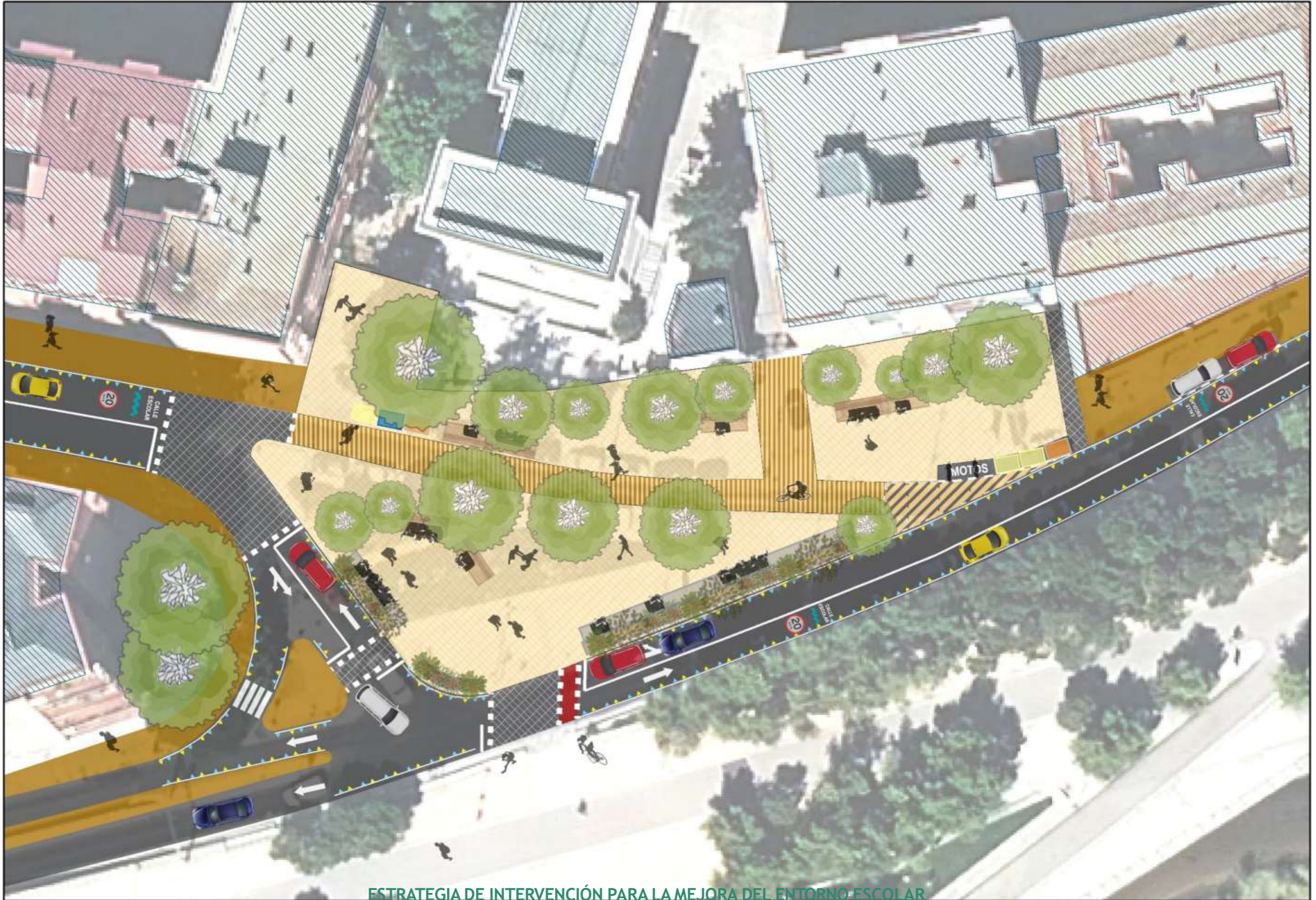
ESTRATEGIA DE INTERVENCIÓN PARA LA MEJORA DEL ENTORNO ESCOLAR